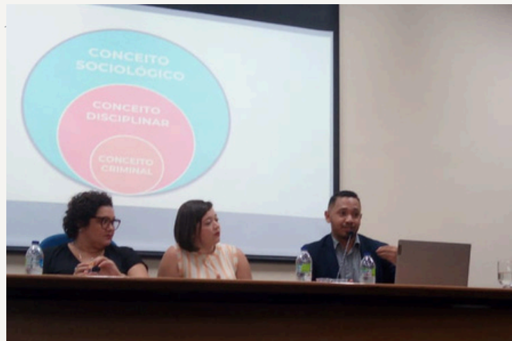
Secretário da CPPAD em fala durante Seminário

Ainda no período de greve, ocorreu o Seminário de Prevenção e Enfrentamento ao Assédio Moral e Sexual em Instituições de Ensino, evento promovido pela CEPA, em parceria com o Comando Local de Greve.