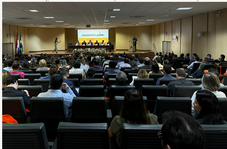
Encontro Regional de Corregedorias - Norte e Nordeste