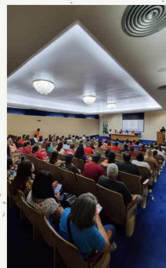
Auditório da Reitoria em evento promovido pela CEPA

Coube aos membros da CPPAD explicar a legislação aplicável ao assédio para fins disciplinares.